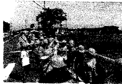
学区探検の付き添い